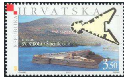
Die Bedeutung der Festung wurde durch die kroatische Post mit einer Briefmarke gewürdigt.

Klicken Sie in das linke Bild, um es in voller Größe ansehen zu können!