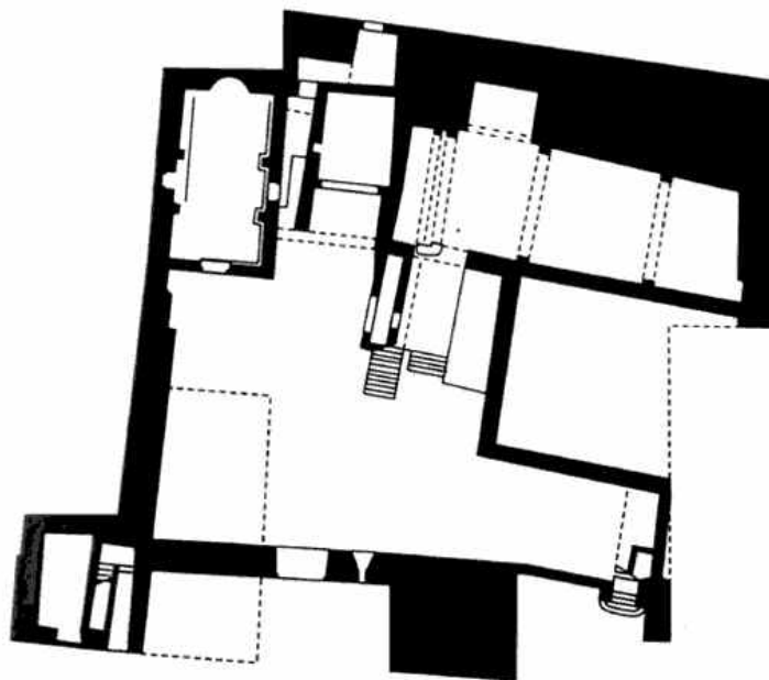
Grundriss der Burg