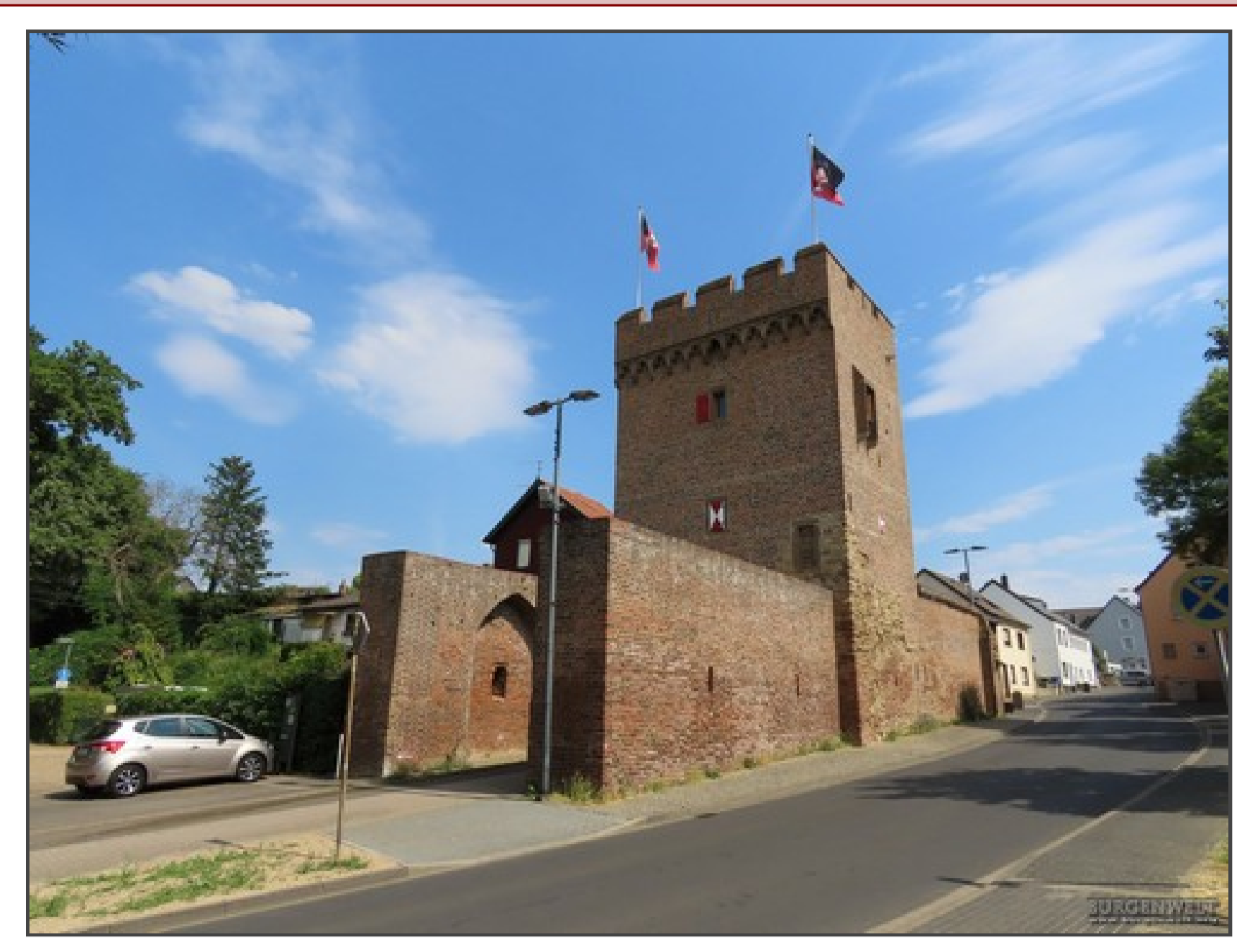
Klicken Sie in das Bild, um es in voller Größe ansehen zu können!

Informationen für Besucher | Bilder | Grundriss | Historie | Literatur | Links