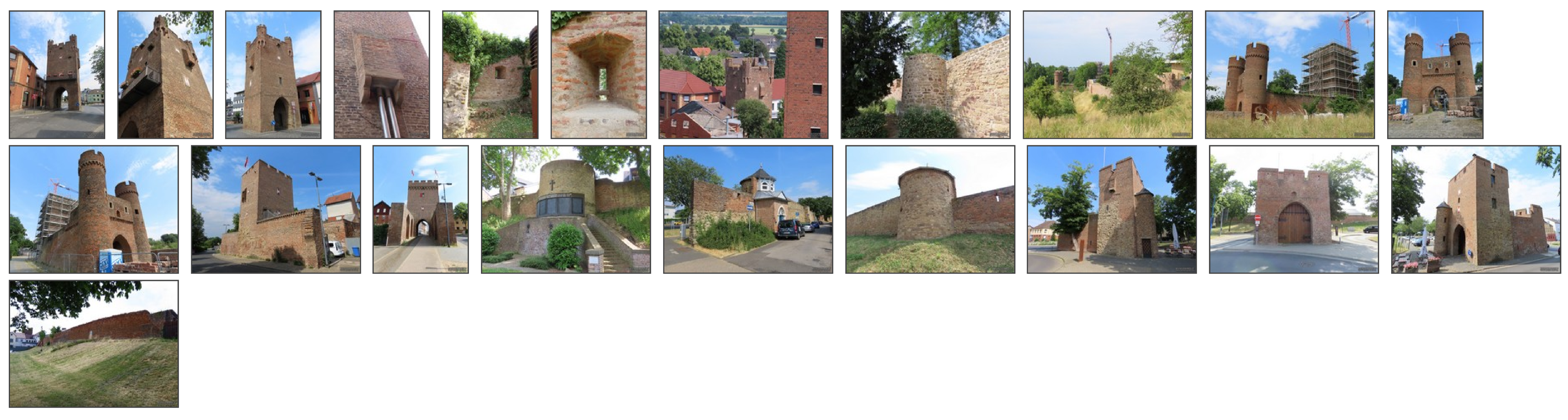
Klicken Sie in das jeweilige Bild, um es in voller Größe ansehen zu können!