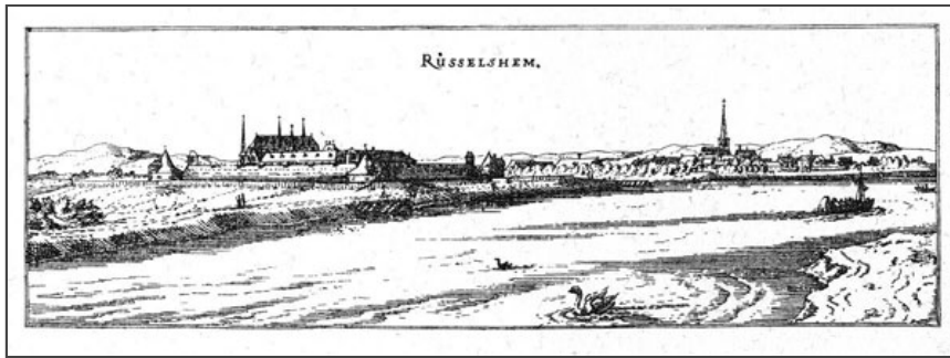
Merian, Matthäus - Topographia Hassiae

Informationen für Besucher | Bilder | Grundriss | Historie | Literatur | Links