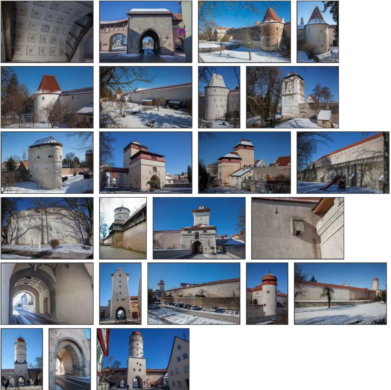
Klicken Sie in das jeweilige Bild, um es in voller Größe ansehen zu können!