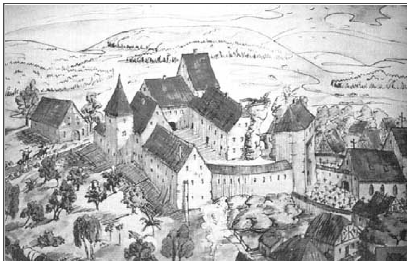
Sulzbacher Heimatblätter, Autor unbekannt.

Informationen für Besucher | Bilder | Grundriss | Historie | Literatur | Links