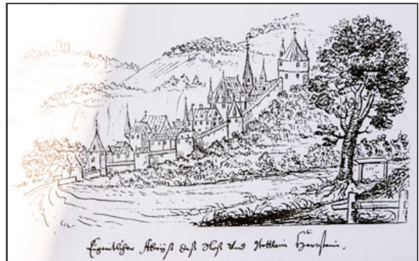
Quelle: Hinweistafel an der Stadtmauer Herrstein: "Eigentlicher Abriß deß Slos und Stettlein Herstein".

Klicken Sie in das jeweilige Bild, um es in voller Größe ansehen zu können!