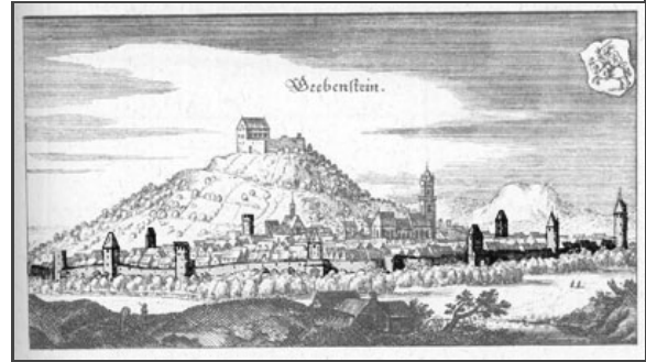
Quelle: Merian, Matthäus - Topographia Hassiae

Klicken Sie in das jeweilige Bild, um es in voller Größe ansehen zu können!