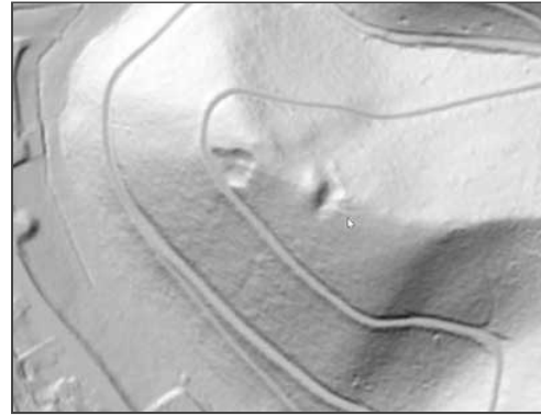
Bodenrelief in Schummerungsansicht. Datengrundlage: Hessische Verwaltung für Bodenmanagement und Geoinformation.

Klicken Sie in das jeweilige Bild, um es in voller Größe ansehen zu können!